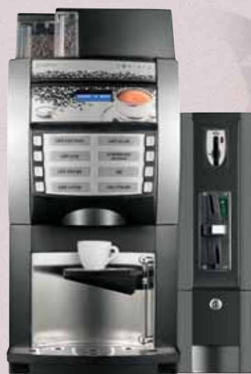
Versión Exprés con módulo de pago