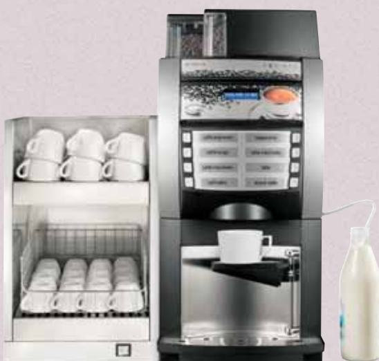
Versión Exprés con capuchinador interno